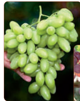
Novas variedades têm potencial produtivo maior, cor, sabor e são resistentes à chuva

A Labrunier teve acesso a estas uvas em visita aos Estados Unidos, África do Sul, Israel e Chile, onde pôde avaliar características e potencial produtivo. As novas variedades foram criadas a partir do cruzamento de campo e seleção massal, realizados em sete instituições de pesquisa destes países.