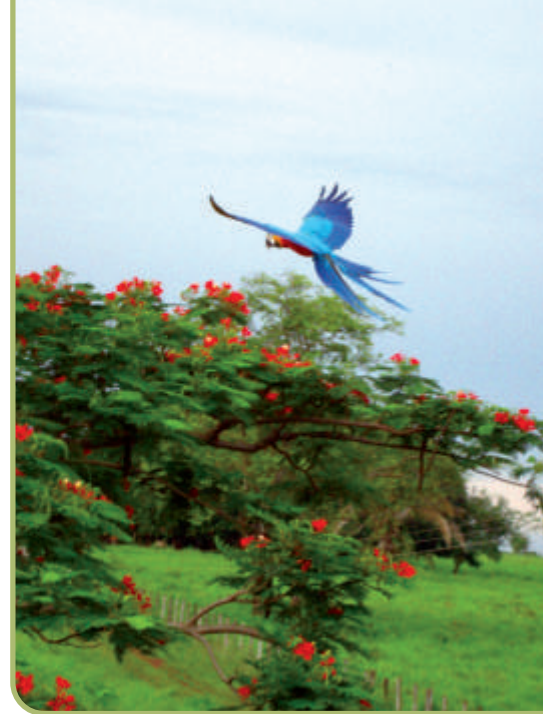
Missão de devolver animais ao seu habitat está sendo cumprida