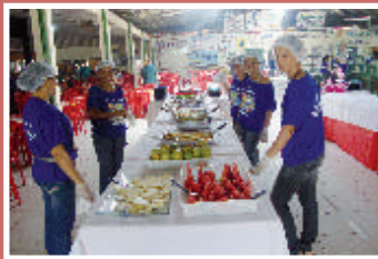
Preparando as mesas...