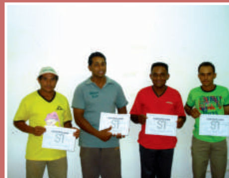
Colaboradores de diversos setores da Produção de suínos participaram do curso de tecnificação