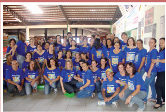
Uma grande equipe se voluntariou para ajudar