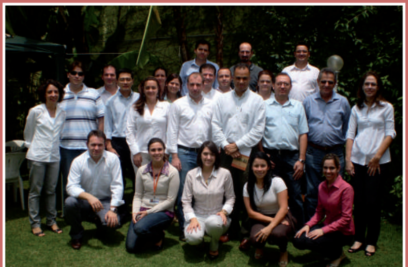
Compradores e negociadores aprimoraram conhecimentos sobre comercialização em São Paulo

O curso buscou desenvolver uma atuação voltada à solução de problemas, tomada de decisões, e desenvolvimento de novos projetos, levando em conta as dimensões: econômica, social e ambiental dos negócios no dia a dia. Participaram do curso, compradores e negociadores das empresas membro da Iniciativa Pró Alimento Sustentável (Ipas): Bunge, Carrefour, Klabin, Nestlé e Sadia, além do Grupo JD.